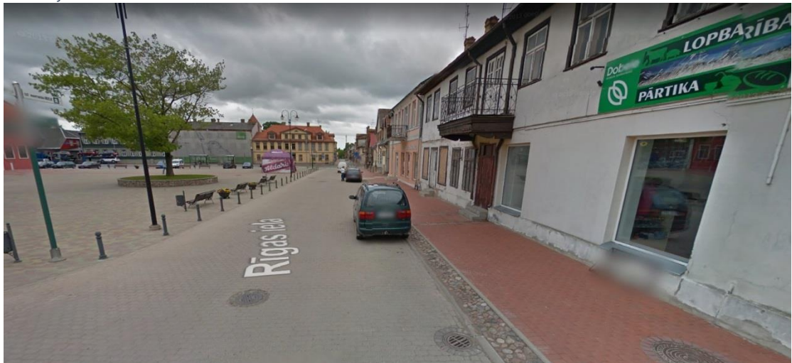
Ilustrācija 4 Rīgas iela