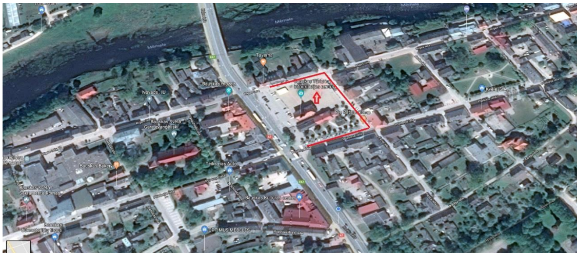
Ilustrācija 6 Kopēja teritorijas karte