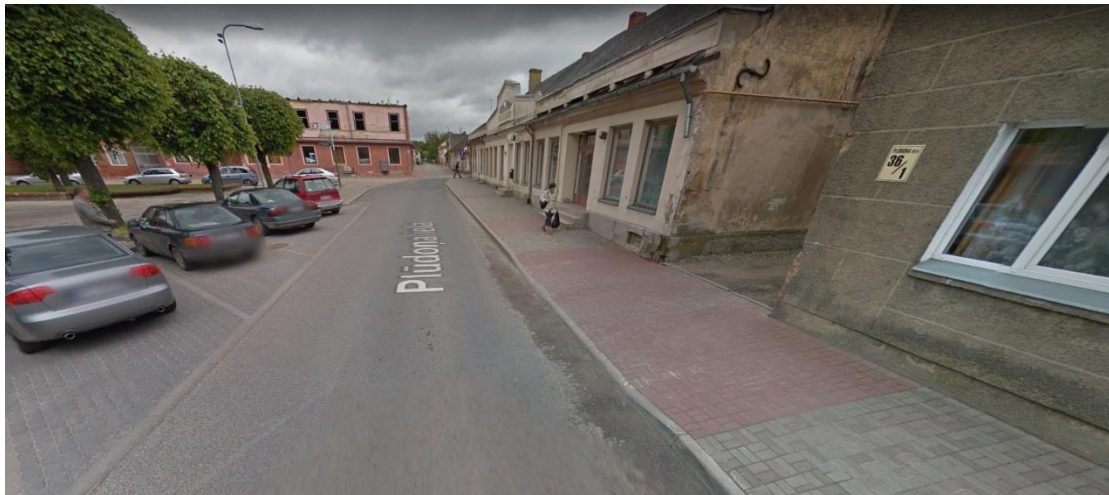
Ilustrācija 1 Plūdoņu iela