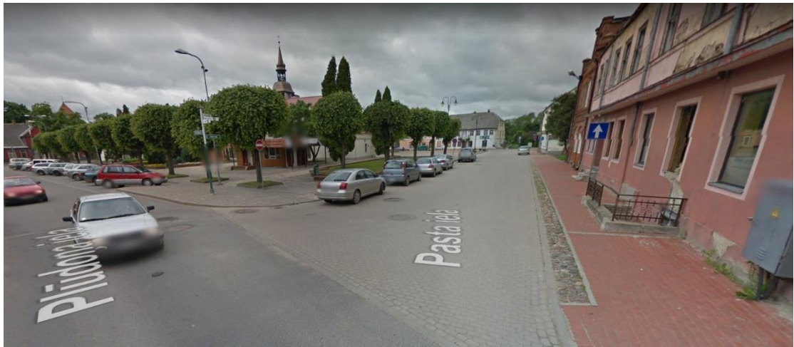
Ilustrācija 3 Pasta iela