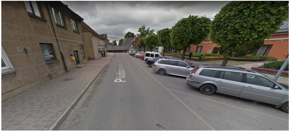
Ilustrācija 2 Plūdoņu ielas turpinājums (2)