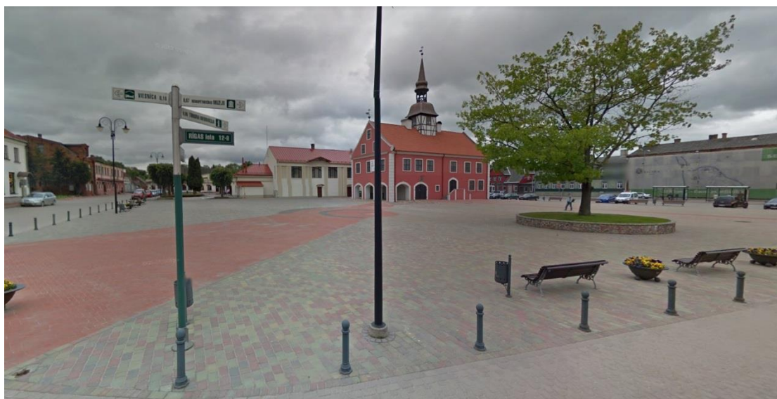
Ilustrācija 1 Galvenais pilsētas laukums - Rātslaukums un Rātsnams